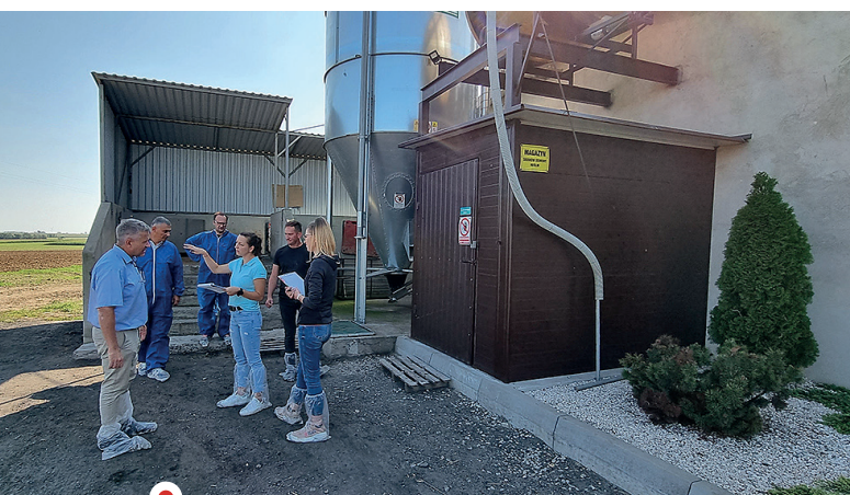
Fot. 6, 7. Do projektu grup sanitarnych pragniemy zaprosić cały sektor wspierający producentów trzody chlewnej, w tym firmy paszowe i transportowe przewożące żywiec. Wiele kwestii do rozwiązania pojawia się na pograniczu dostawy towarów i usług