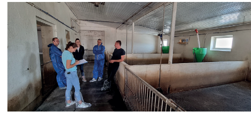
Fot. 1-3. W pierwszej fazie wszyscy chętni rolnicy będą poddani audytowi bioasekuracji i ocenie zabezpieczeń. Celem tych działań jest opracowanie standardu oraz procedur operacyjnych dla Grupy