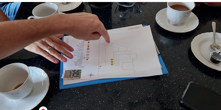
Fot. 5. Opracowanie planu bioasekuracji często wymaga dokładnego omówienia i wypracowania najlepszej możliwej opcji, która będzie jednocześnie bezpieczna, jak i możliwa do wdrożenia w codziennej pracy gospodarstwa